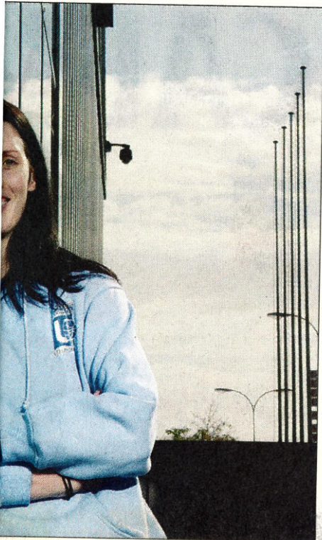
...n dernière où elle a été contrainte Eurocup. (DAVID MARCHON)

...ir où je t-elle en res sou- n. «Mis rs lors- tements plus à à bonne que en- ce.» «Je effet, malgré une carrière plus qu'intéressante – quatre ans dans une Université de New York, une expérience en Allemagne avant d'arriver en Suisse, à Brunnen –, la pivot de 27 ans n'a jamais pris part à des joutes continentales. «Je n'ai pas planifié ma vie. Je suis devenue basketteuse professionnelle parce que j'en ai eu